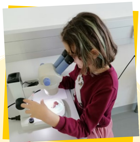
Beim Forschen lernen die Kinder Wissenschaft hautnah kennen und anwenden